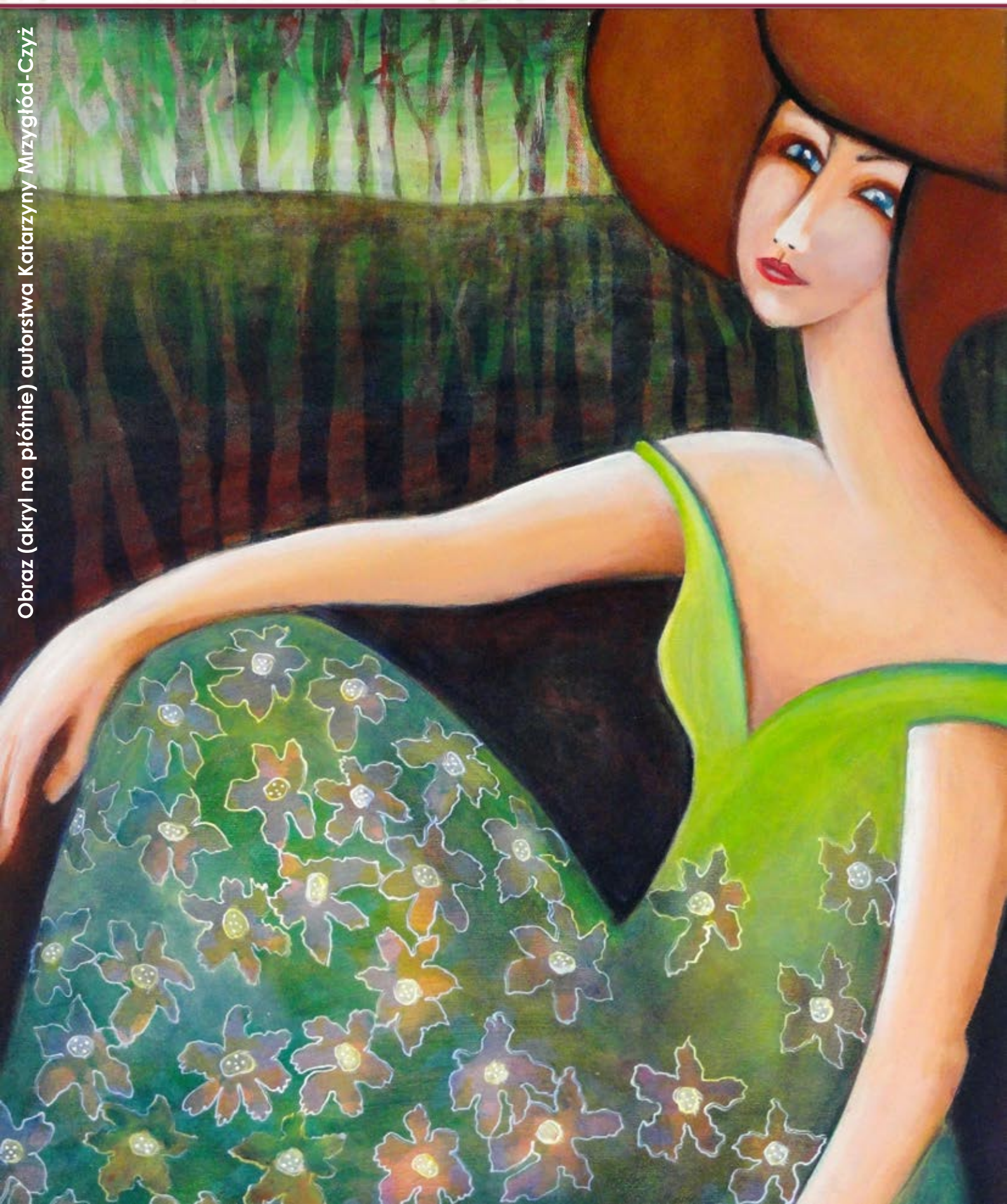
Obraz (akryl na płótnie) autorstwa Katarzyny Mrzygłód-Czyż